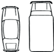
Grafico dell'incidente al momento dell'urto

Indicare i danni visibili al veicolo Leasys